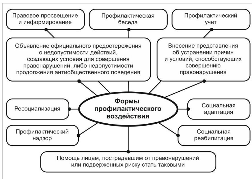
Рис. 1. Формы профилактического воздействия (согласно ст. 17 ФЗ «Об основах системы профилактики правонарушений в Российской Федерации») 1

1 Федеральный закон от 23.06.2016 г. № 183-ФЗ «Об основах системы профилактики правонарушений в Российской Федерации». URL: https://www.consultant.ru/document/cons_doc_LAW_199976 (дата обращения: 01.10.2023).