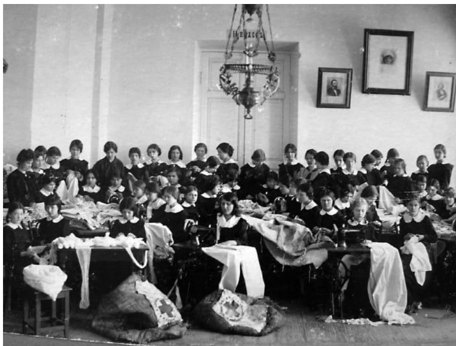
Рис. 1. Ученицы Ардатовской женской гимназии за шитьем белья для «Красного креста», 1915 год

Интересен опыт Мариинской женской гимназии в г. Перми по продаже рукодельных работ учениц с целью покрытия стоимости материалов. Так, «... в 1899 г. продажа ученических рукодельных работ дала 146 р. 95 коп., материалу для них куплено было на 48 р. 42 коп.» [19, с. 21].