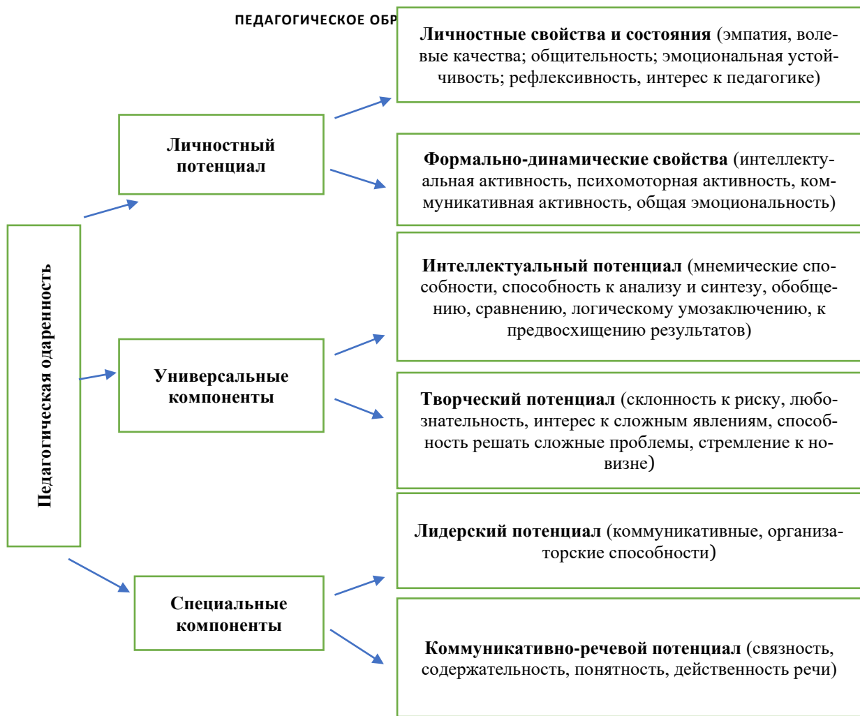
Рис. 1. Структура ранней педагогической одаренности обучающихся

На становление педагогической одаренности оказывает влияние ряд факторов: