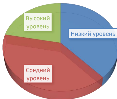
Рис. 1. Распределение испытуемых по уровням сформированности когнитивного компонента

На основе полученных результатов можно сделать вывод, что из всех студентов, обучающихся на профиле «Начальное образование», правильно со всеми заданиями справились лишь 23 человека (21,9%). Остальные респонденты допустили ошибки в первой части задания, где нужно было объяснить смысл слов и выражений. Трудности возникли с осмыслением прочитанного текста. Допущены ошибки в задании на соответствие (рис. 1).