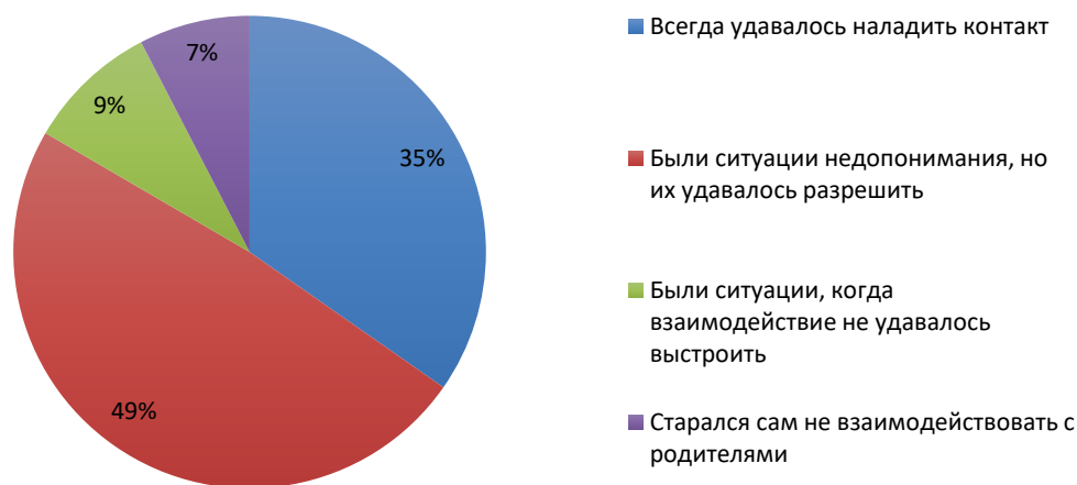
Рис. 2. Ситуации, когда не удавалось наладить взаимодействие вожатого и родителя

Следующий вопрос демонстрировал необходимые навыки вожатых, которые