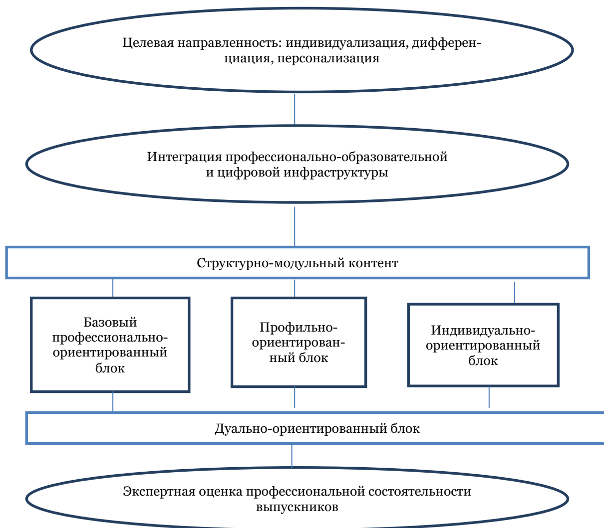
Рис. 1. Персонализированная профессионально-образовательная платформа обучающихся

Структурная организация платформы обеспечивает вариативность и уровневость образовательного контента, модули ориентированы на формирование универсальных компетенций (мягких навыков) и предоставляют возможность обучающимся реализовать себя по персонализированным траекториям.