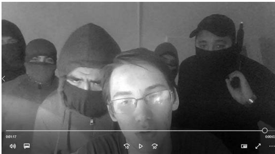
Рис. 2. Монологическое выступление студента и немая сценка на тему текста

Подготовка этого представления заняла примерно 15 минут — от идеи до воплощения. Фотографии учащиеся взяли, как было указано выше, из поисковой системы «Яндекс-картинки». Диалог был составлен с использованием вокабуляра текста.