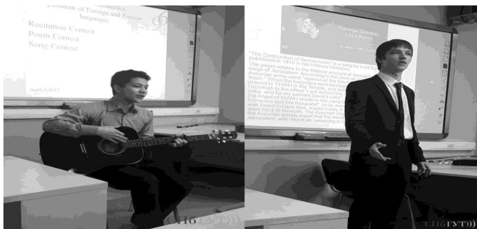
Рис. 10. Конкурс чтецов, исполнителей песен

Анкетирование студентов выявило, что новая форма организации учебного процесса, включающая самостоятельную работу, позволила студентам более полно реализовать свои образовательные потребности, а именно способствовала более эффективному развитию их навыков устной речи на иностранном языке. У студентов заметно повысилась мотивация к изучению иностранного языка; развились умения поиска информации и работы с ней; учащиеся стали качественнее работать с текстом, быстрее анализировать информацию, сортировать ее для решения заданной задачи, выбирать оптимальное решение.