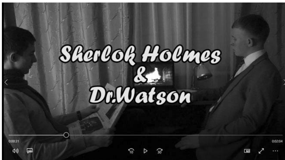
Рис. 3. Студенты рассказывают о современной жизни Великобритании в образах Ш. Холмса и доктора Ватсона

Разговорные темы являются итоговой работой в семестре, поэтому у студентов, как правило, не остается времени на их качественную подготовку. Как результат, выполнение задания производится не на должном уровне, а презентация выступления проходит формально.