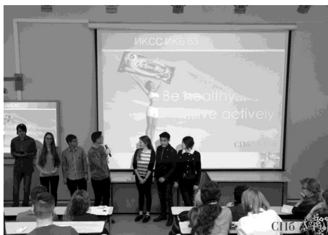
Рис. 9. Выступление студентов «Eco-Contest»

В Санкт-Петербургском государственном университете телекоммуникаций им. проф. М. А. Бонч-Бруевича ежегодно проводится «Неделя иностранных языков», активное участие в подготовке и проведении которой принимают студенты. «Неделя иностранных языков — 2018» включала викторины по страноведению, КВН, конкурс чтецов и исполнителей песен, конкурс переводов. Отзывы студентов о данном мероприятии были опубликованы в Интернете [7].