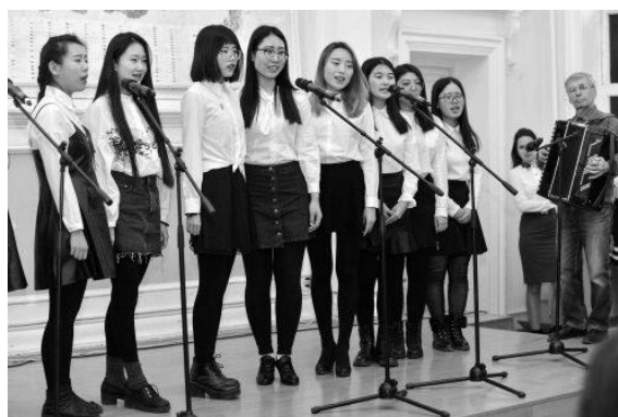
Рис. 6. Выступают студенты из КНР, обучающиеся в Уральском государственном горном университете